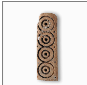
Placa de Hueso, siglos XI - XII.