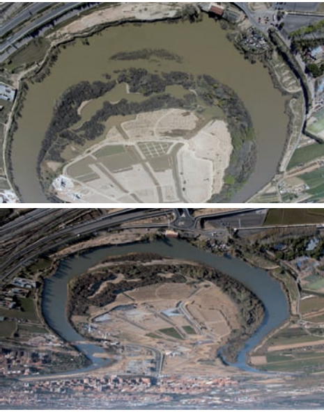
Meandro de Ranillas