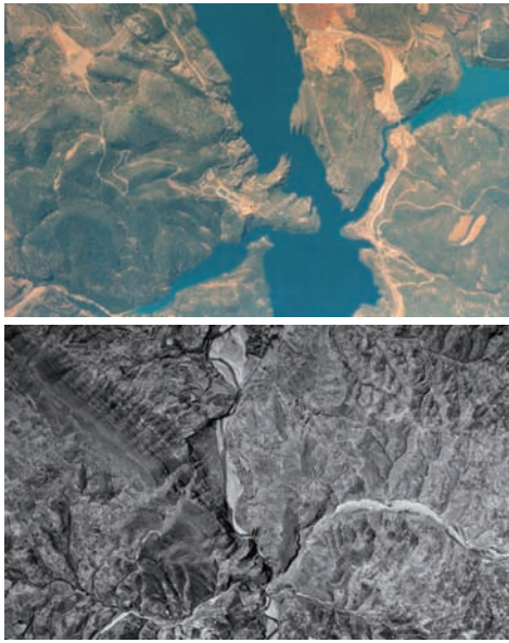
Valle del Cinca antes de la construcción del embalse de El Grado