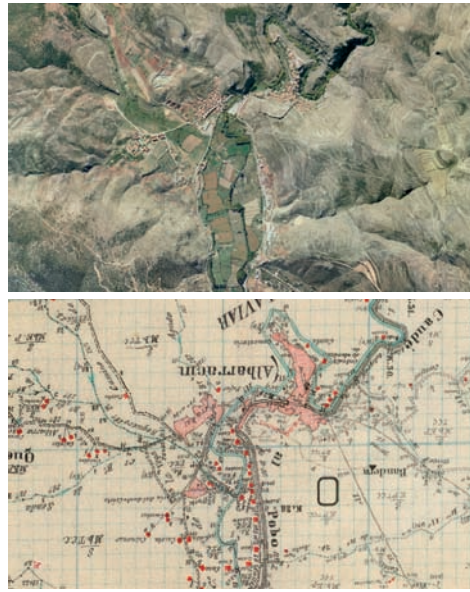
Albaracín, Plano 1925, Instituto Geográfico