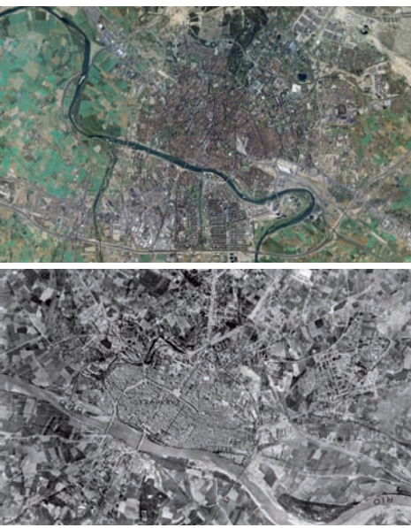
Zaragoza, Fotografía aérea 1927, Vuelo USAF