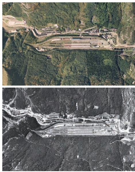
Estación Internacional de Camfrán Fotografía aérea 1956, Vuelo USAF