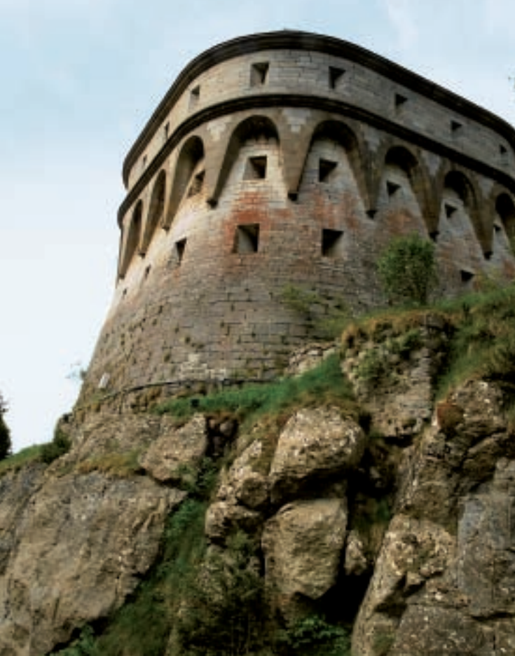
▲ Torre de fusileros

Los caminos vuelven a confluir justo a la salida de Canfranc Estación en el puente de Secrás. Enseguida entra en escena el moderno túnel carretero de Somport de ocho kilómetros que se estrenó en enero de 2003 para unir los valles de Canfranc y Aspe. La ruta jacobea pasa justo por delante de la boca del túnel así que los peregrinos tienen que ir con mucha precaución aquí y en los próximos quinientos metros. En este tramo, se vuelve a atravesar otro túnel camino de Jaca. A la salida, el trazado desciende hasta el fondo del río Aragón.