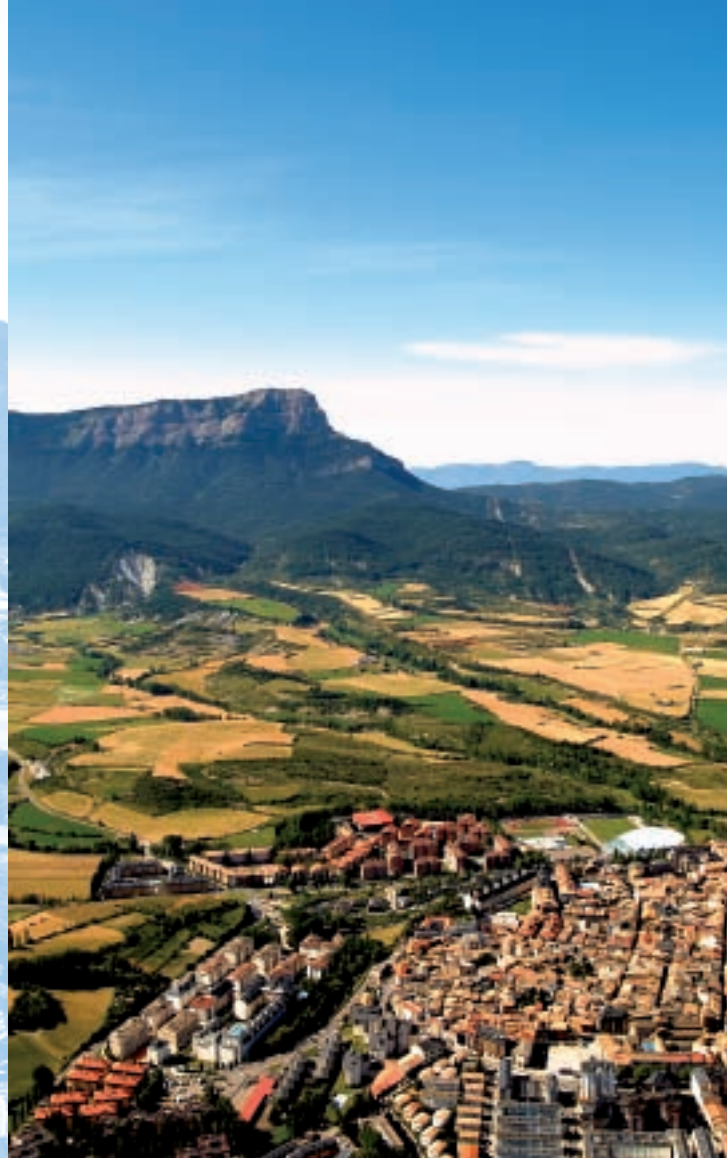
▼ Jaca junto a la Peña Oroel

Hay que cruzar con cuidado para tomar una cabañera y, tras un kilómetro y medio, atravesar de nuevo la carretera para llegar a un puente peatonal sobre el río Gas que permite alcanzar la Casa del Municionero . A un paso, Las Batiellas , un campo de maniobras militares. Más adelante, en Santa Cilia, espera un magnífico albergue.