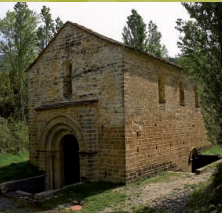
▲ San Adrián de Sasabe

En el camino, Castiello tiene fama de ser el pueblo de las cien reliquias. Junto a la parroquial, asoman los restos de la antigua fortaleza medieval. Al lado de los antiguos lavaderos restaurados, está la fuente de Casadioses, decorada con una concha. A la salida de Castiello, tras cruzar el puente sobre el río Aragón, la ruta sigue por la derecha y una pasarela diseñada en 2009 salva el cauce del río Ijeuz. Siguiendo ese trazado se llega a Torrijos y de ahí Jaca y el descanso tras una dura jornada están a un paso.