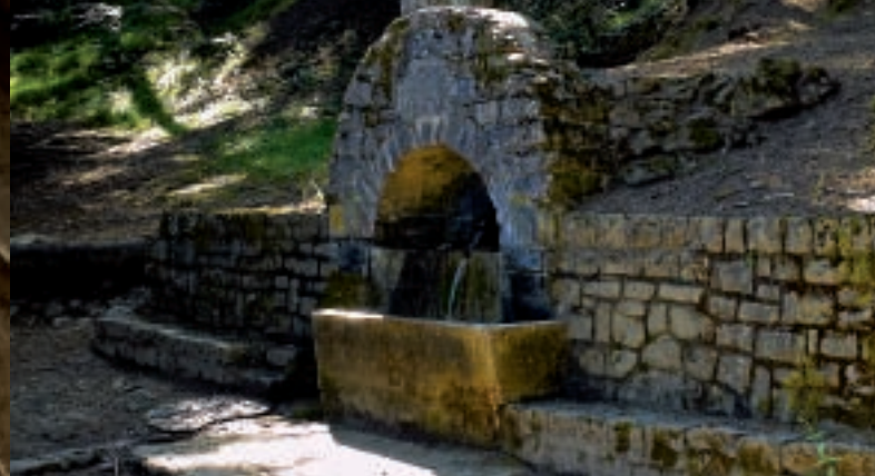
▲ Fuente del Paco. Villanúa

discurría bajo el pasadizo abovedado de la construcción defensiva. También merecen una visita la torre de Aznar Palacín o el conjunto monumental de La Trinidad. De Canfranc, se sale cruzando el puente de Abajo, del Cementerio o de la Trinidad. Medieval, reconstruido en 1599, su silueta es una de las más preciadas del Camino de Santiago.