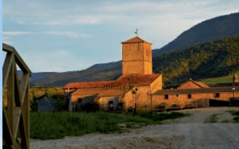
▲ Atardecer desde la ribera del Aragón. Santa Cilia

Arrés fue villa real y perteneció a la dote de la reina Ermesinda. Aupado sobre una cresta rocosa del monte Cerbero, desde los restos del castillo se dominan el Bailés y la Canal de Berdún. Junto al castillo, en el siglo XVI, se alzó la parroquia de Santa Águeda y se reconstruyó la fortificación empleando modelos tardo-góticos. En la orilla del Camino de Santiago, ubicaron un molino harinero y el monasterio de Santa Columba en el siglo X. Hoy el albergue, tras su recia fachada de piedra, encierra un interior cálido y acogedor.