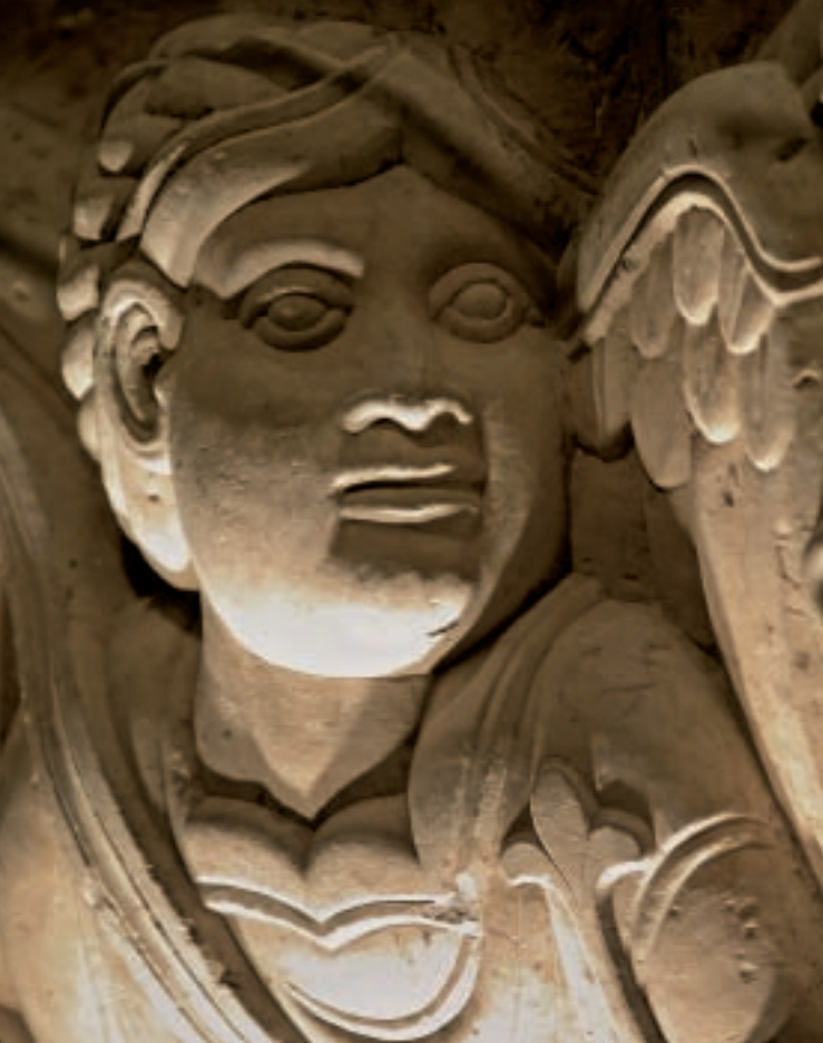
▲ Capitel románico. Iglesia de Santiago, Jaca