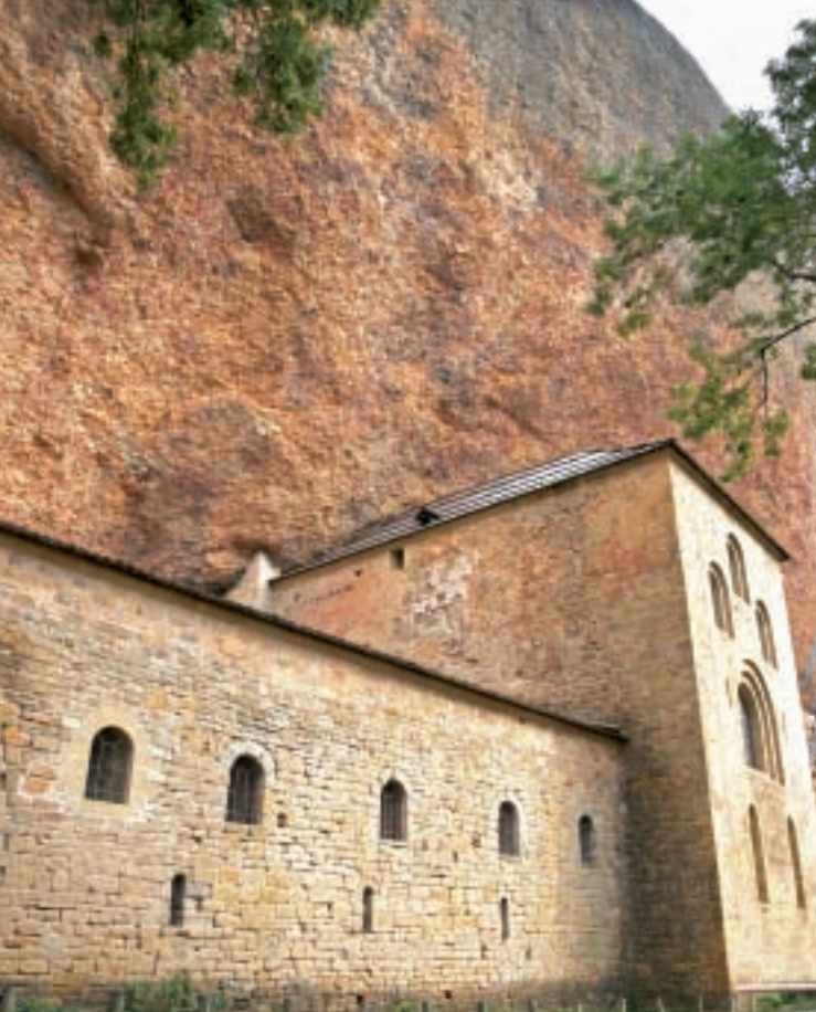
▲ Monasterio Viejo, encajado en la montaña