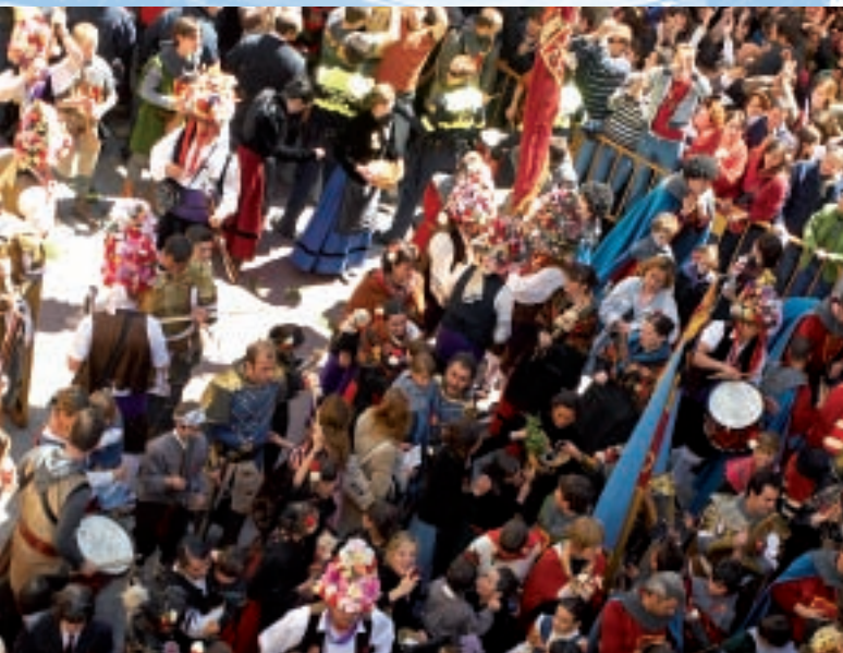
▲ Primer viernes de mayo, Jaca

A NTES de partir de Jaca conviene sacar dinero para los próximos tres días porque los cajeros brillan por su ausencia hasta Sangüesa. Enseguida se llega a la N-240. Después de superar la gasolinera, se cruza para continuar por la izquierda de la nacional junto al antiguo matadero municipal. Un andador y una senda próxima a la carretera conducen hasta el cementerio y la ermita de la Victoria, un sencillo edificio del siglo XIX. Está ubicado en una explanada en la que, según la tradición, los bravos jaqueses y jaquesas vencieron a los invasores árabes en el año 761. Hoy se rememora esa gesta cada Primer Viernes de Mayo.