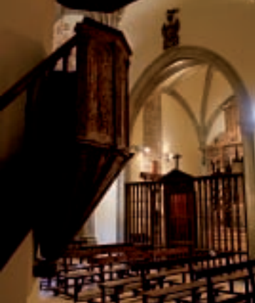
▲ Púlpito aéreo de la iglesia de Undués de Lerda