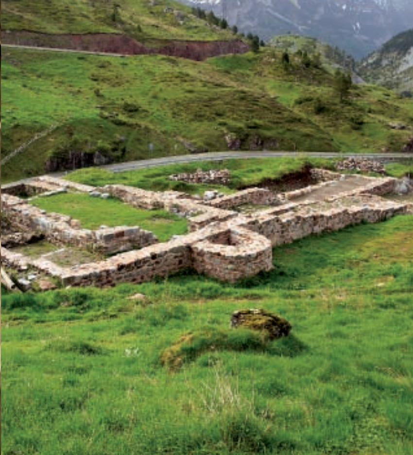
▲ Ruinas del Hospital de Santa Cristina

Las señalizaciones sugieren atravesar la carretera, el barranco de Rioseta y sumergirse en una senda que atraviesa un precioso bosque y pasa junto a algún que otro búnker. Los construyeron soldados y prisioneros republicanos por orden de Franco para defender la frontera de posibles invasiones francesas. Se han hilvanado deliciosos tramos auténticos recuperados de la ruta jacobea en medio de vistas espectaculares. El Coll de Ladrones se levantó a finales del siglo XIX sobre otro más antiguo para defender este valle fronterizo. Mimetizados con el entorno se alzan dos edificios revestidos de piedra del país. Abandonado en 1961, hoy ha recuperado su esplendor.