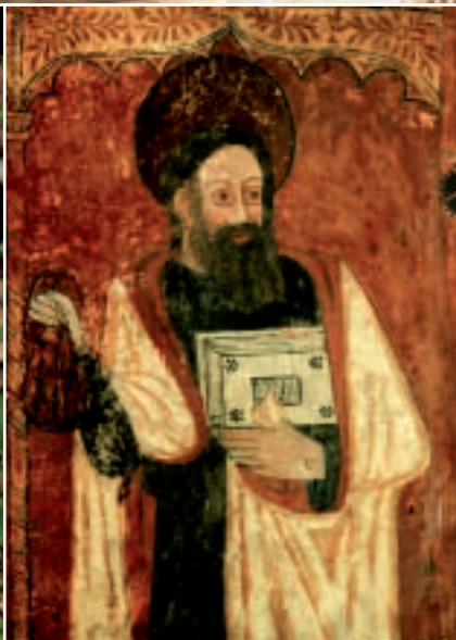
▲ Pintura mural Iguácel