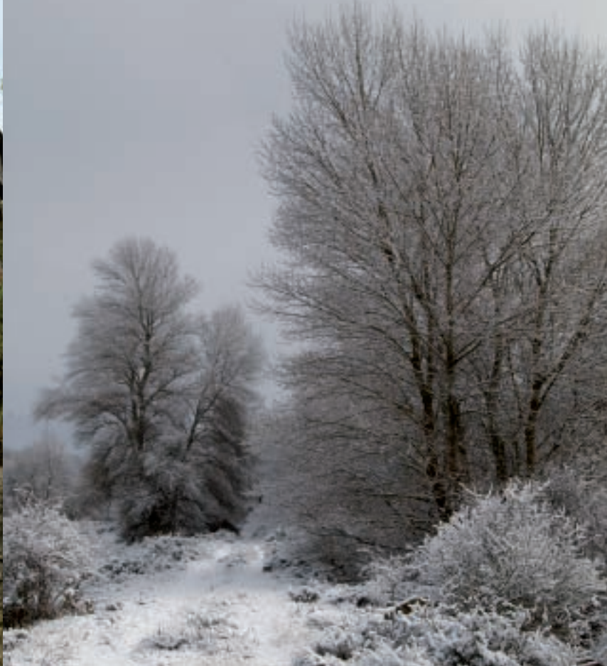
▲ Mañana de invierno en la ribera del Aragón

De nuevo se ofrecen dos posibilidades. La de la derecha es menos recomendable a pesar de que sigue por el camino casi original y se asoma a la Torreta de Fusileros que se levantó en el siglo XIX para prevenir posibles ataques. Se trata de una sorprendente