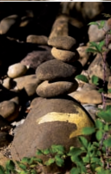
▲ Señal del camino

◀ Portada: En el Somport, escaleras de bajada hacia Candanchú