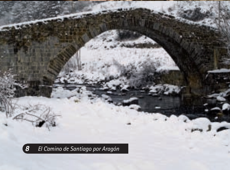
▲ Puente de abajo, Canfranc Pueblo