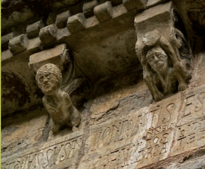
▲ Detalle del alero. Santa María de Iguácel