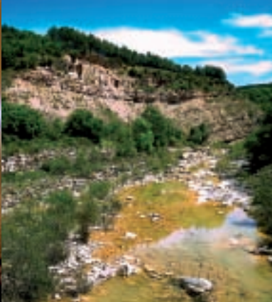
▲ Río Regal en Ruesta

Ruesta asoma por sorpresa coronada por la silueta de su impresionante castillo en ruinas que conserva dos esbeltas torres. Ruesta invita a imaginar cómo fue cuando poseía más de un centenar de casas habitadas antes de que las tierras de labor se las tragara el pantano. Una capa de abandono sepultó el pueblo y el que parecía inexpugnable castillo. El silencio se adueñó de este territorio hasta que, en 1988, la Confederación Hidrográfica del Ebro lo cedió al sindicato Confederación General del Trabajo para su recuperación. Ubicadas junto a la iglesia, Casa Valentín y Casa Alifonso se han convertido en un par de albergues juvenil y de peregrinos con capacidad para sesenta y cuatro personas. El trazado atraviesa el pueblo, descendiendo en dirección a las aguas azuladas del pantano hasta el río Regal que se cruza por una pasarela de madera para entrar en un gran camping con capacidad para doscientas cincuenta personas que abre en verano.