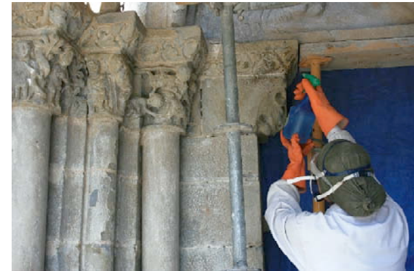
Preparación para la restauración y consolidación de los capiteles y del tímpano de la puerta principal de entrada a la Iglesia de Nuestra Señora de Baldós.

Sobre esta portada historiada, se sitúa lo que hoy es una hornacina de arco de medio punto peraltado y que en su día sería un vano abierto. A ambos lados de la misma, dos arquillos de tradición lombarda apean en ménsulas con pequeñas cabecitas esculpidas.