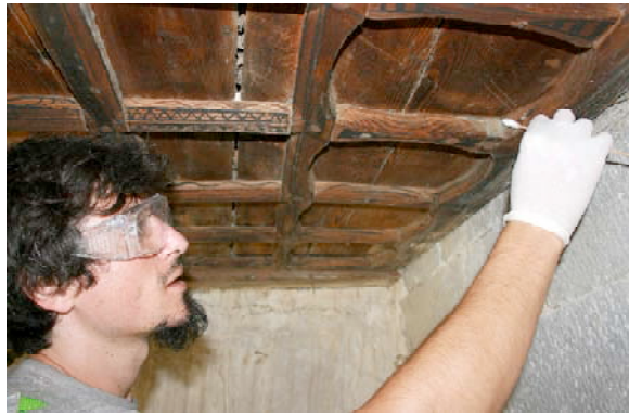
Restauración pinturas mudéjares en el artesonado bajo el coro.

La piedra de los arquillos de la torre presentaba un estado de conservación preocupante, con una patología