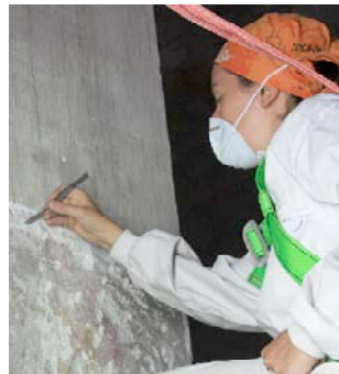
Catas realizadas en el pilar de acceso al crucero.

En el intradós del arco encontramos un pantocrátor, una crucifixión y el agnus dei, mientras que en el trasdós y en la jamba lateral se desarrolla una galería de rostros masculinos y una cruz patada. En la pared de fondo, se escenifican, de forma compartimentada, lo que parecen ser escenas de la vida de un santo u obispo. Bajo las escenas, decoración de pergamino plegado y cortinaje de cierre inferior.