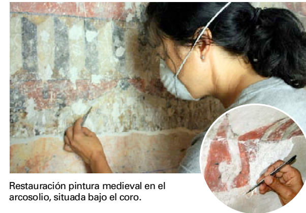
Restauración pintura medieval en el arcosolio, situada bajo el coro.

En la capilla del brazo del crucero, parte de una crucifixión en el paramento de fondo y en el intradós, una decoración de tipo geométrico que parece reproducir azulejos. Por